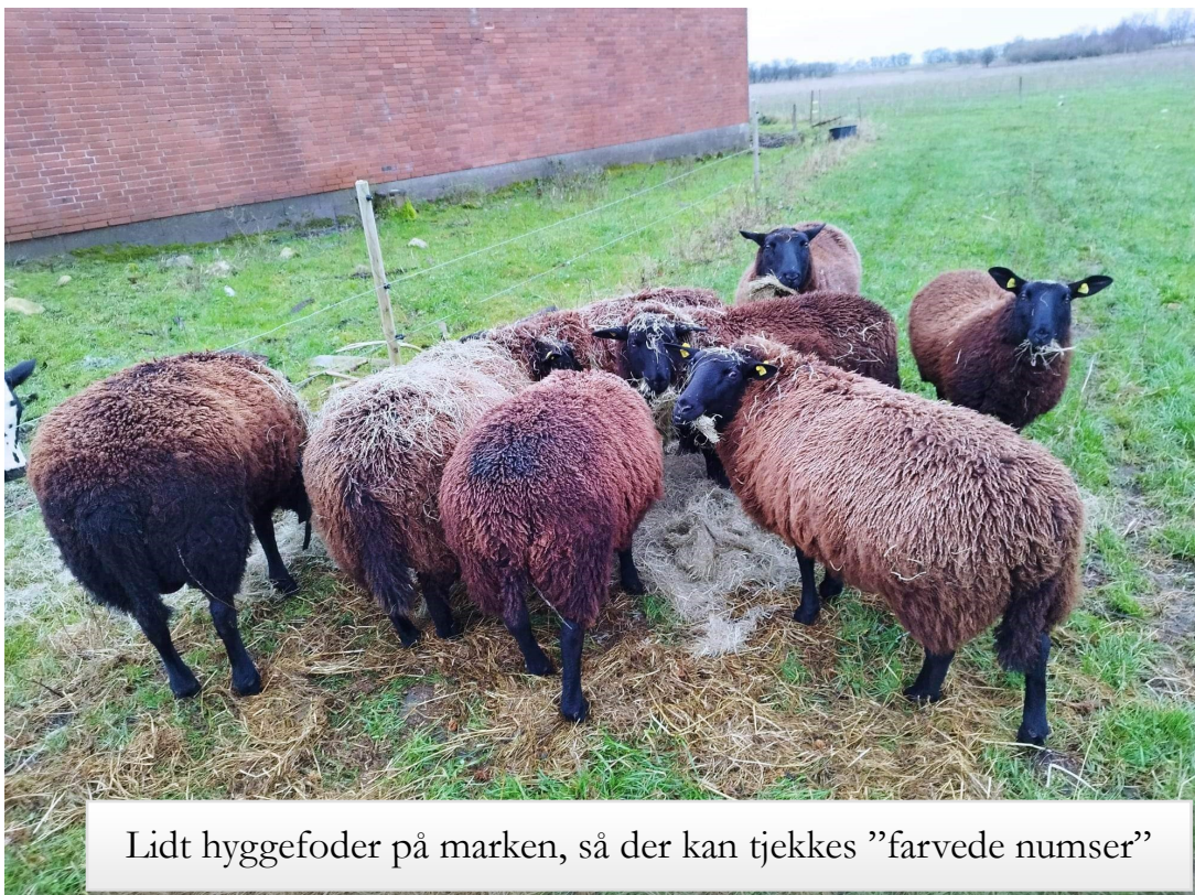
Lidt hyggefoder på marken, så der kan tjekkes ”farvede numser”