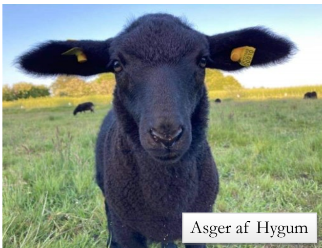
Asger af Hygum

Ikke nok med at Sånen er middelstor, nøjsom, gode læmmere, har den smukkeste sorte pels, lette at gøre tamme men også var en dansk race, gjorde udslaget.