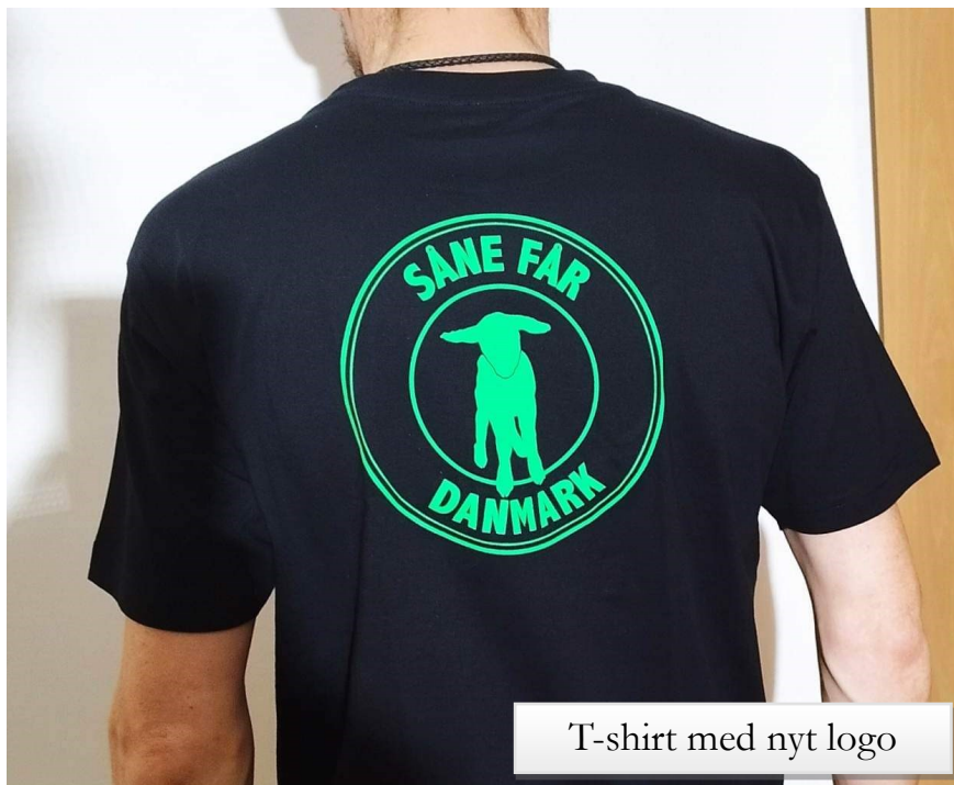
T-shirt med nyt logo